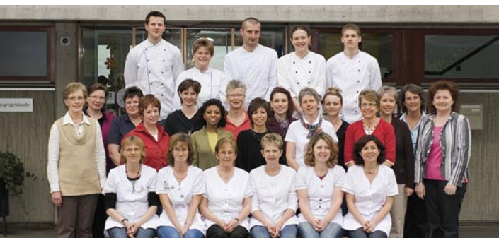
Mitarbeitende Kurhaus Frühling 2009