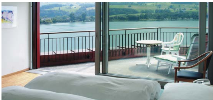
Zimmer mit Aussicht Kurhaus